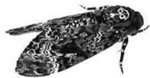
クロメンガタスズメ 2018.10 長和町採取