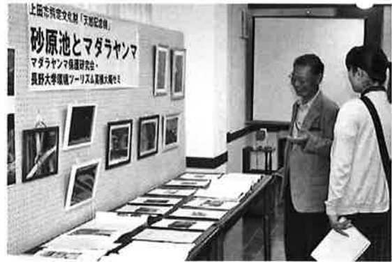
マダラヤンマ研究会展示