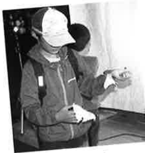
夜間観察会 少年とオオミズアオ 2018.8.11